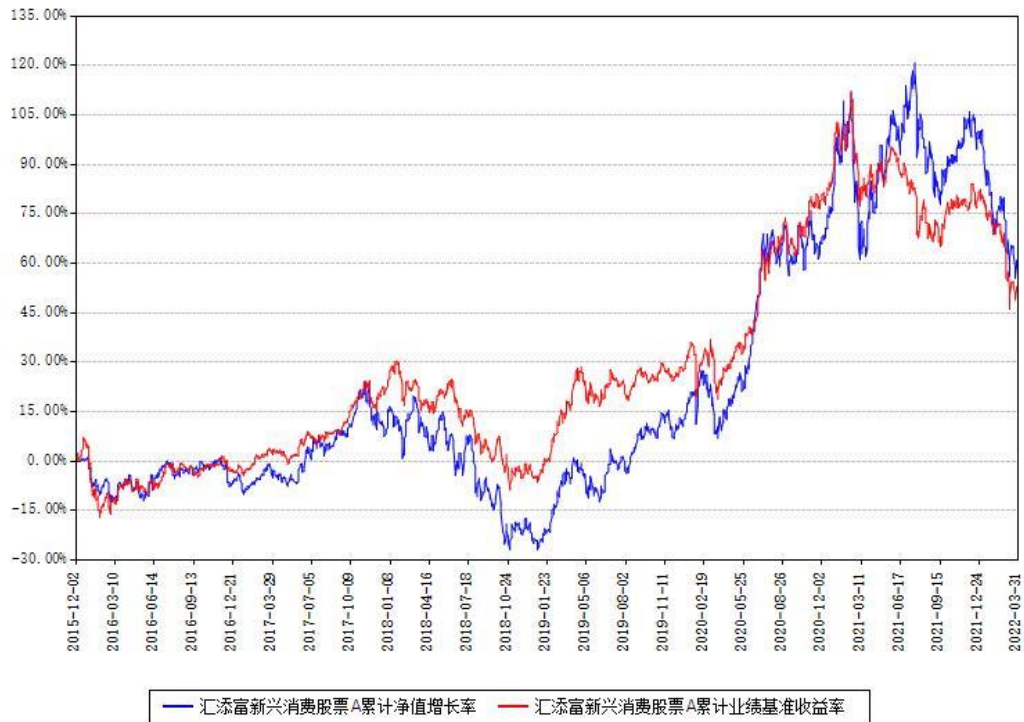
汇添富新兴消费股票A累计净值增长率与同期业绩比较基准收益率对比图