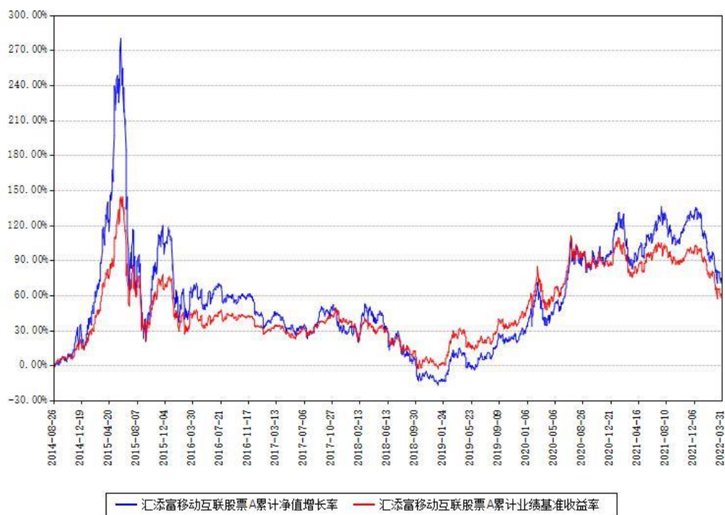
汇添富移动互联股票A累计净值增长率与同期业绩基准收益率对比图