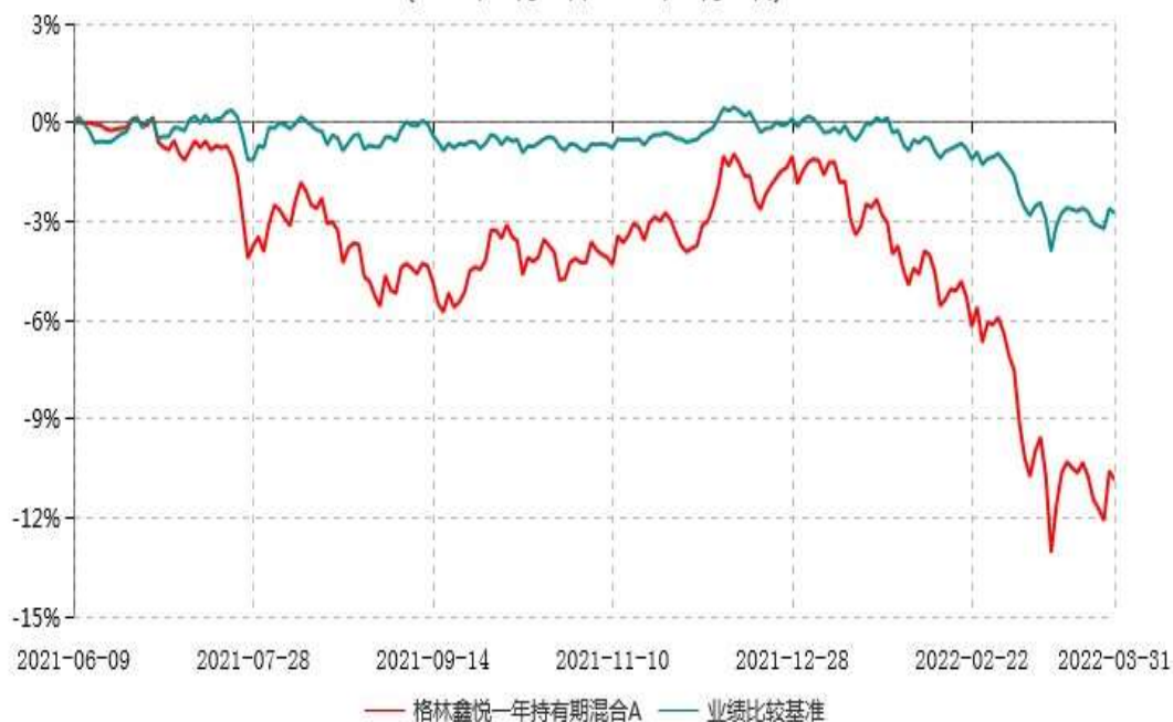
格林鑫悦一年持有期混合A累计净值增长率与业绩比较基准收益率历史走势对比图 (2021年06月09日-2022年03月31日)