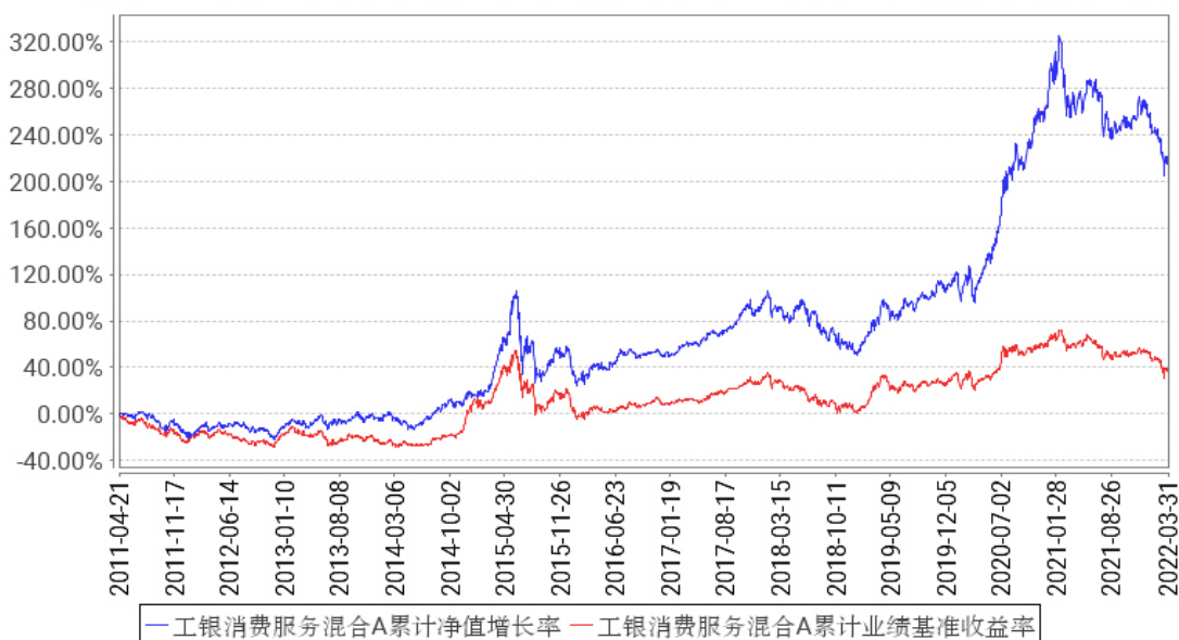
工银消费服务混合A累计净值增长率与同期业绩比较基准收益率的历史走势对比图