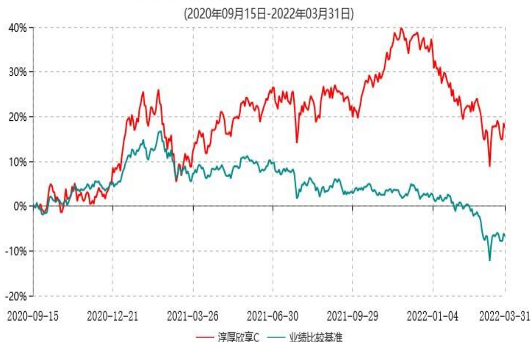
淳厚欣享C累计净值增长率与业绩比较基准收益率历史走势对比图

注：本基金基金合同生效日为 2020 年 9 月 15 日。按基金合同规定，本基金自基金合同生效起 6 个月内为建仓期。建仓期结束时本基金的各项投资比例均符合基金合同约定。