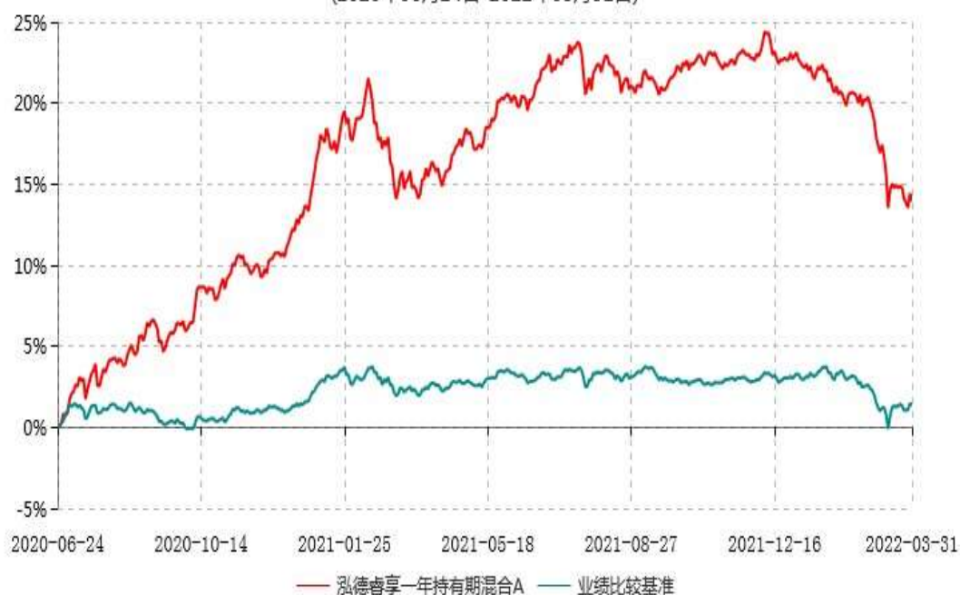
泓德睿享一年持有期混合A累计净值增长率与业绩比较基准收益率历史走势对比图 (2020年06月24日-2022年03月31日)