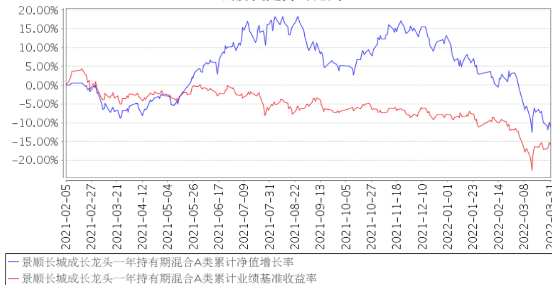
景顺长城成长龙头一年持有期混合A类累计净值增长率与同期业绩比较基准收益率的历史走势对比图