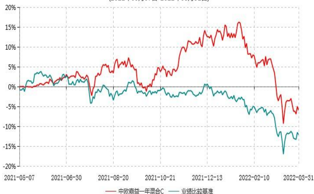
中欧嘉益一年混合C累计净值增长率与业绩比较基准收益率历史走势对比图 (2021年05月07日-2022年03月31日)

注：本基金基金合同生效日期为 2021 年 5 月 7 日，自基金合同生效日起到本报告期末不满一年，按基金合同的规定，本基金自基金合同生效起六个月为建仓期，建仓期结束时各项资产配置比例已符合基金合同约定。