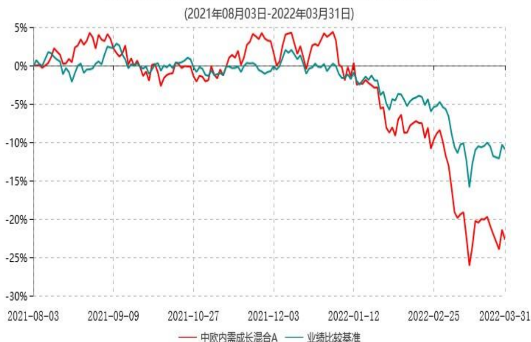
中欧内需成长混合A累计净值增长率与业绩比较基准收益率历史走势对比图

注：本基金基金合同生效日期为 2021 年 8 月 3 日，自基金合同生效日起到本报告期末不满一年，按基金合同的规定，本基金自基金合同生效起六个月为建仓期，建仓期结束时各项资产配置比例已符合基金合同约定。