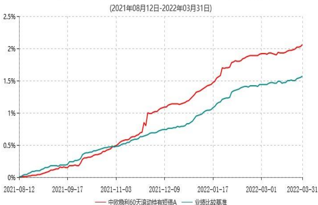
中欧稳利60天滚动持有短债A累计净值增长率与业绩比较基准收益率历史走势对比图

注：本基金基金合同生效日期为 2021 年 8 月 12 日，自基金合同生效日起到本报告期末不满一年，按基金合同的规定，本基金自基金合同生效起六个月为建仓期，建仓期结束时各项资产配置比例已符合基金合同约定。