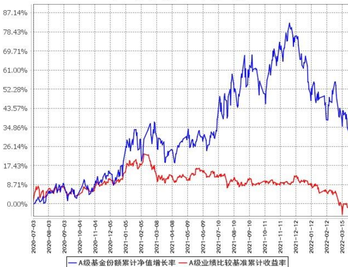
A级基金份额累计净值增长率与同期业绩比较基准收益率的历史走势对比图 (2020年7月3日至2022年3月31日)