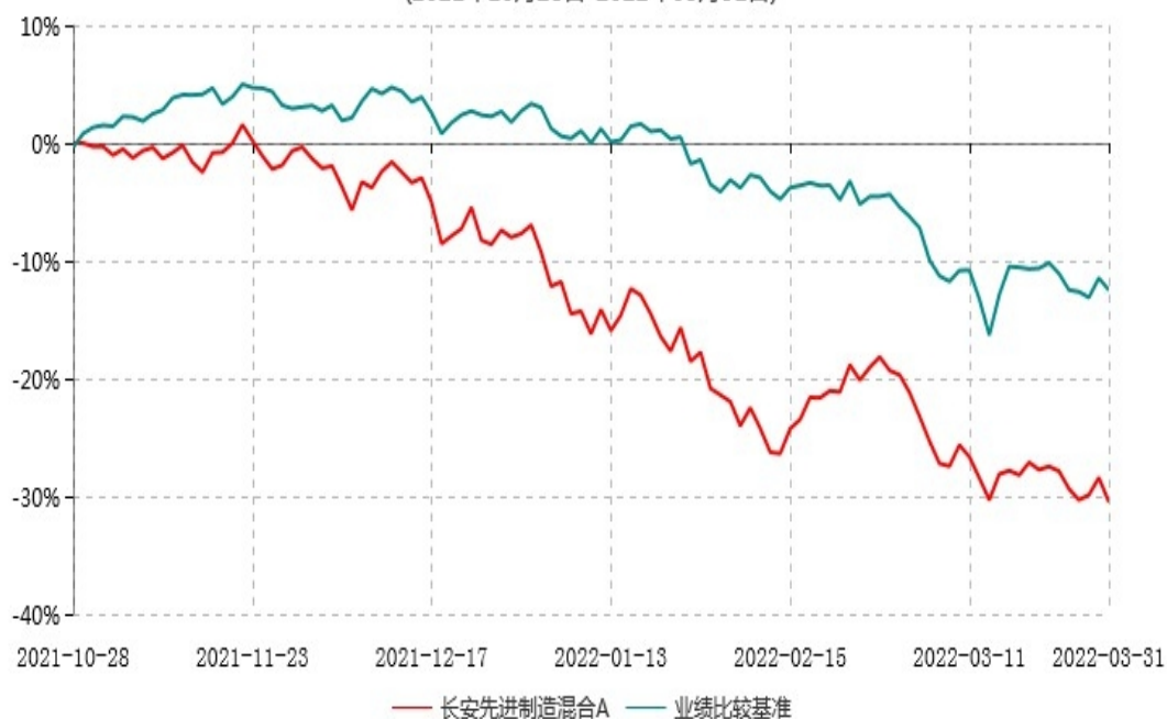
长安先进制造混合A累计净值增长率与业绩比较基准收益率历史走势对比图 (2021年10月28日-2022年03月31日)

根据基金合同的规定,自基金合同生效之日起 6 个月内基金各项资产配置比例需符合基金合同要求。本基金还处于建仓期。基金合同生效日至报告期末,本基金运作时间未满一年。图示日期为 2021 年 10 月 28 日至 2022 年 03 月 31 日。