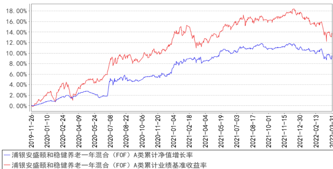
浦银安盛颐 and 稳健养老一年混合 (FOF) A类累计净值增长率与同期业绩比较基准收益率的历史走势对比图