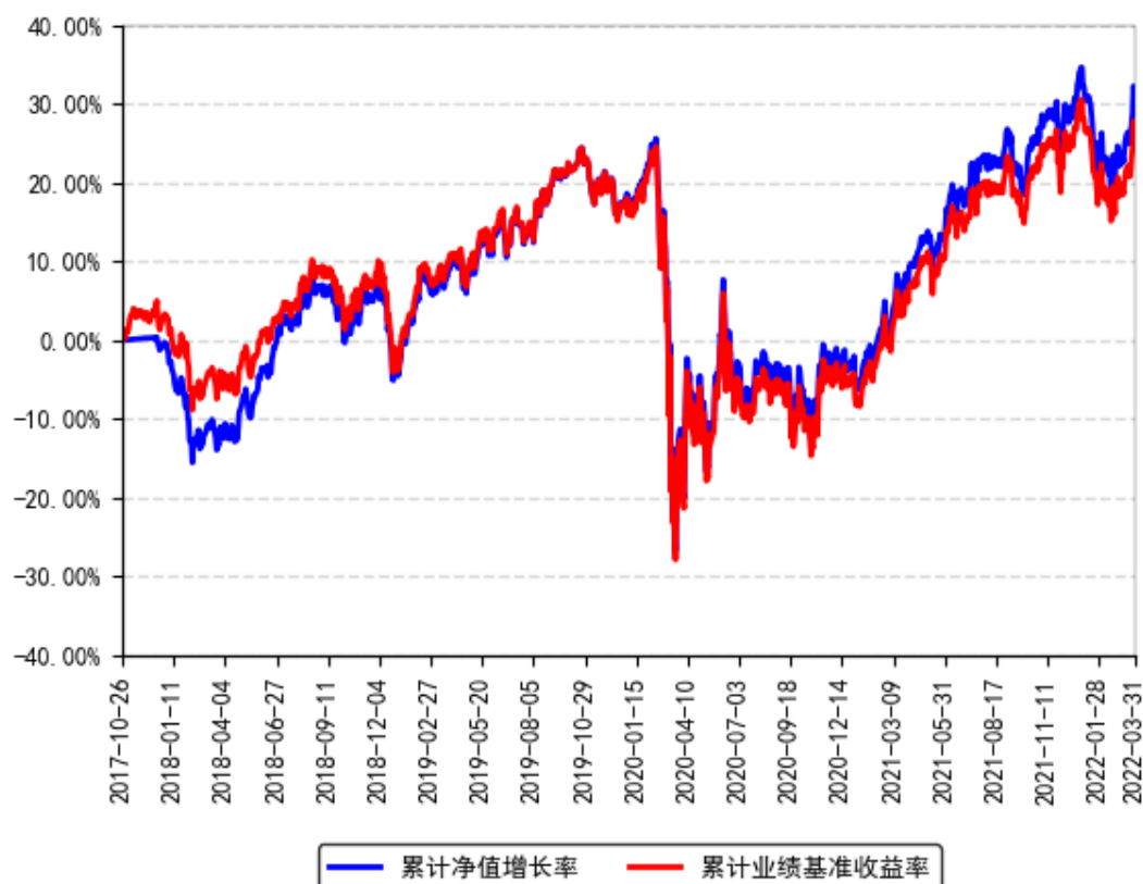
美国REIT累计净值增长率与同期业绩比较基准收益率的历史走势对比图