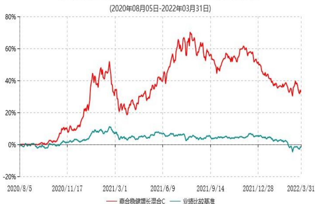
嘉合稳健增长混合C累计净值增长率与业绩比较基准收益率历史走势对比图

注：本基金基金合同于 2020 年 08 月 05 日生效，按照基金合同规定，本基金建仓期为基金合同生效之日起 6 个月。建仓期结束时，本基金的各项资产配置比例符合基金合同约定。