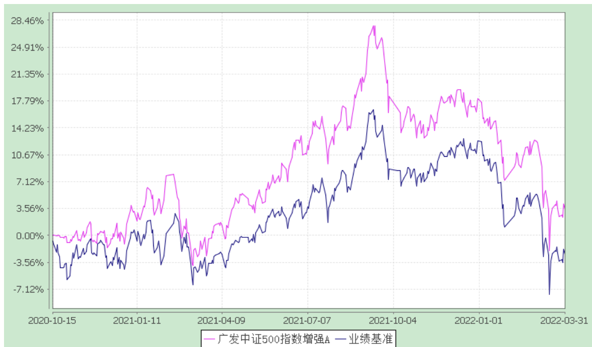
广发中证 500 指数增强 C: