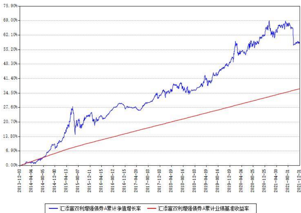
汇添富双利增强债券A累计净值增长率与同期业绩基准收益率对比图