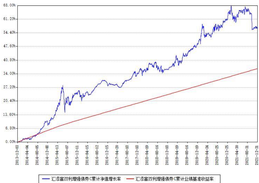
汇添富双利增强债券C累计净值增长率与同期业绩基准收益率对比图