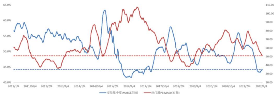
市场交易集中度与热门股 PE (2011.1.4-2022.4.20)

如下图，将每日成交额前 300 名的股票定义为“热门股”，蓝线为热门股当日成交额占全 A 成交额比例的 60 日移动平均线；红线为热门股成交额加权 PE 的 60 日移动平均线。