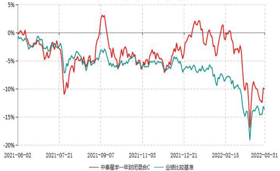
中泰星宇一年封闭混合C累计净值增长率与业绩比较基准收益率历史走势对比图 (2021年06月02日-2022年03月31日)