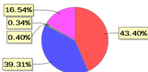
投资组合资产配置图表(2022年3月31日)