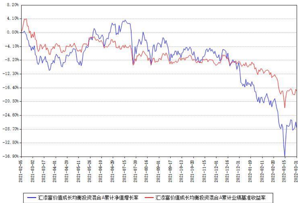
汇添富价值成长均衡投资混合A累计净值增长率与同期业绩基准收益率对比图