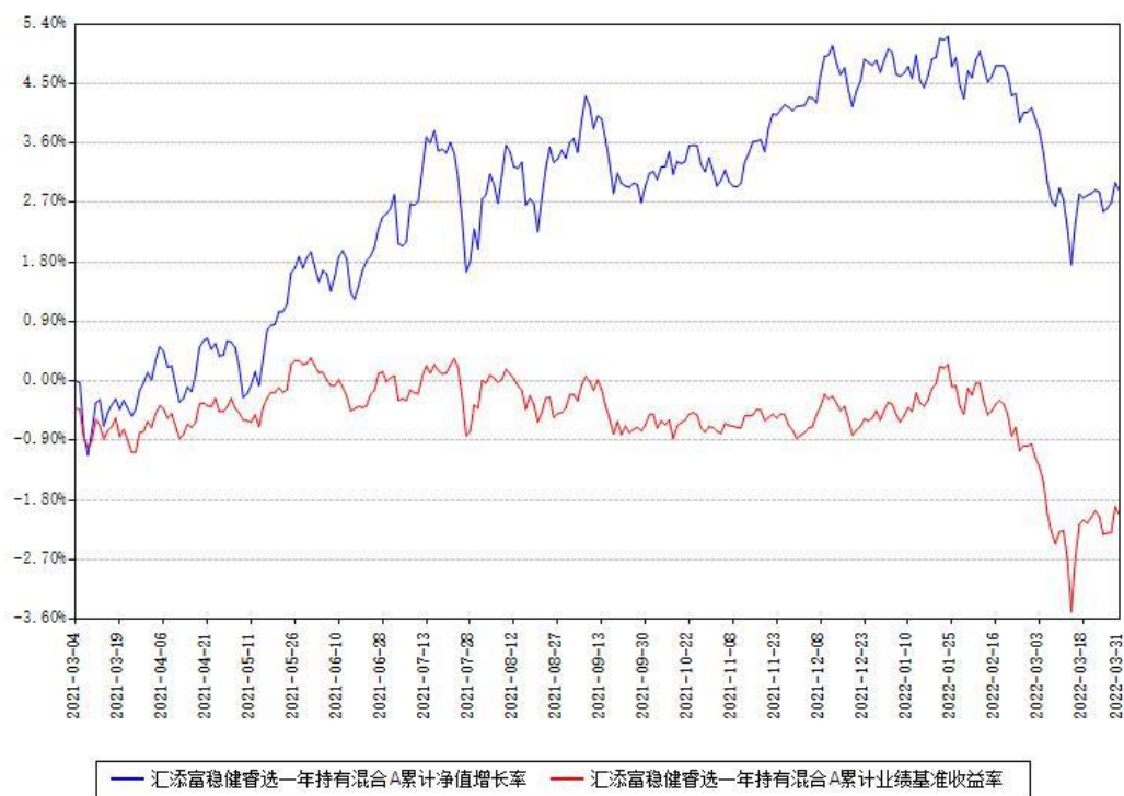
汇添富稳健睿选一年持有混合A累计净值增长率与同期业绩基准收益率对比图