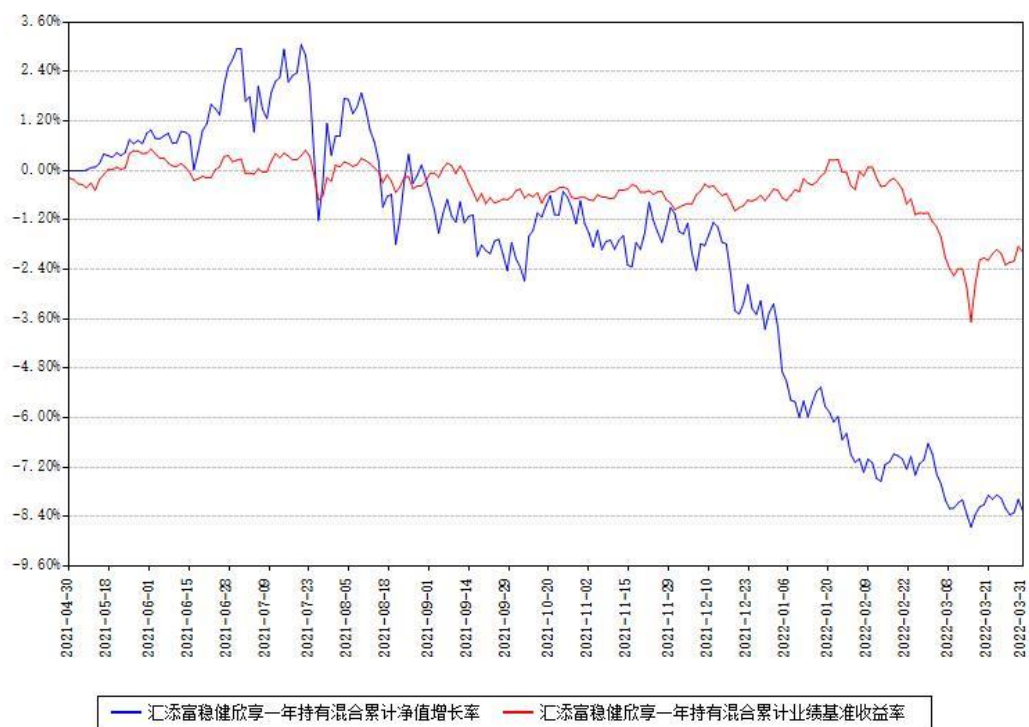
汇添富稳健欣享一年持有混合累计净值增长率与同期业绩基准收益率对比图