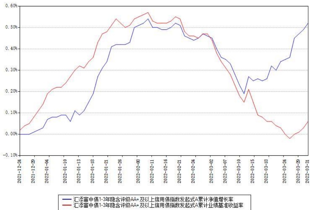
汇添富中债1-3年隐含评级AA+及以上信用债指数发起式A累计净值增长率与同期业绩基准收益率对比图