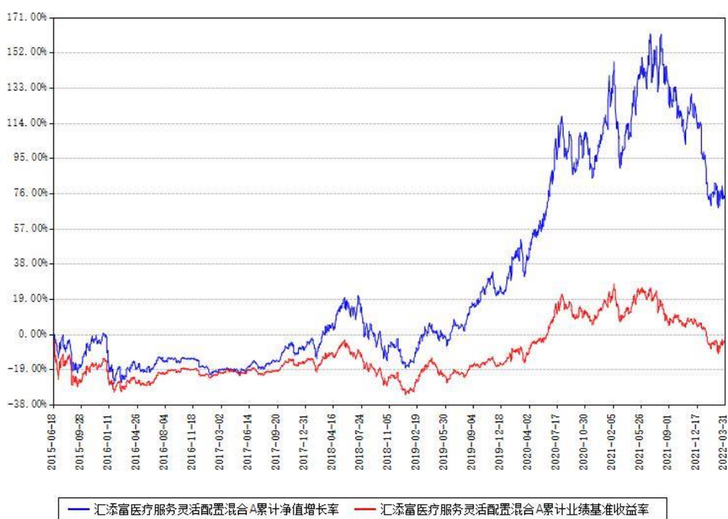
汇添富医疗服务灵活配置混合A累计净值增长率与同期业绩基准收益率对比图

(二) 自基金合同生效以来基金累计净值增长率变动及其与同期业绩比较基准收益率变动的比较图