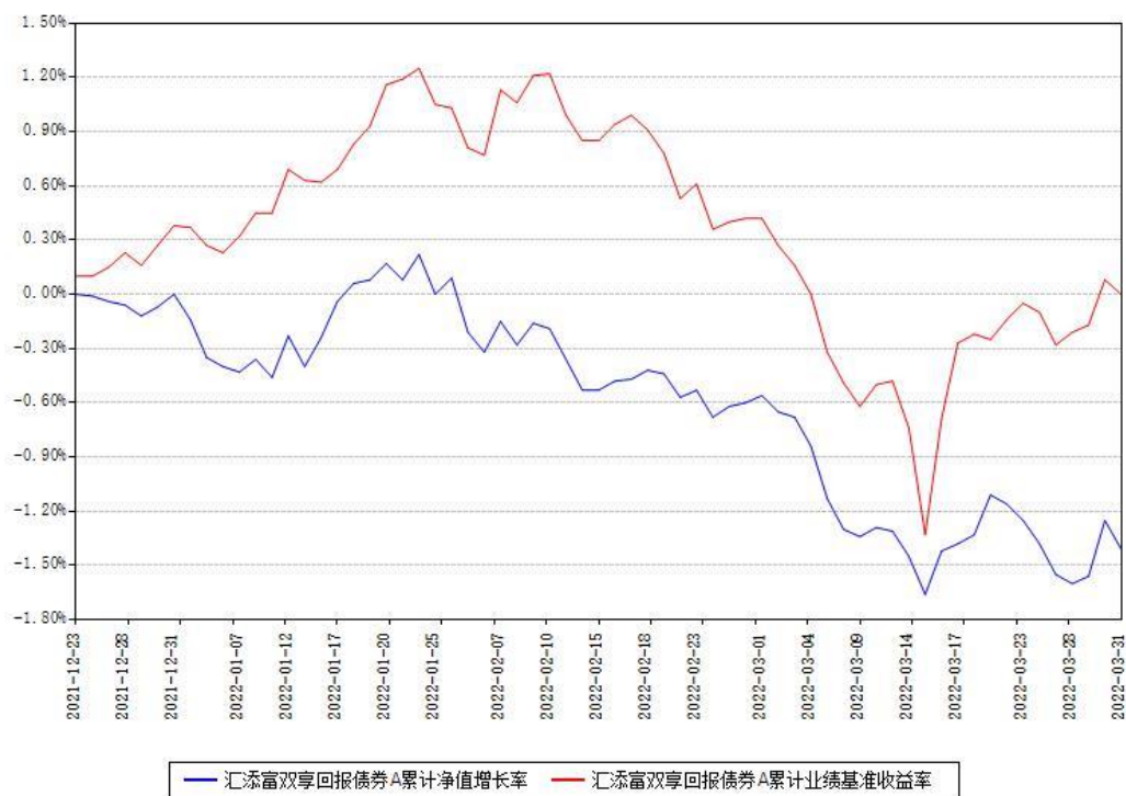
汇添富双享回报债券A累计净值增长率与同期业绩基准收益率对比图

(二)自基金合同生效以来基金累计净值增长率变动及其与同期业绩比较基准收益率变动的比较