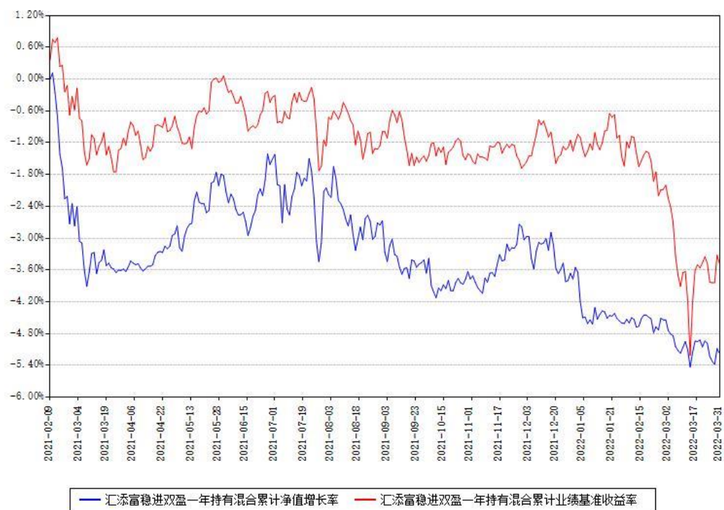
汇添富稳进双盈一年持有混合累计净值增长率与同期业绩基准收益率对比图