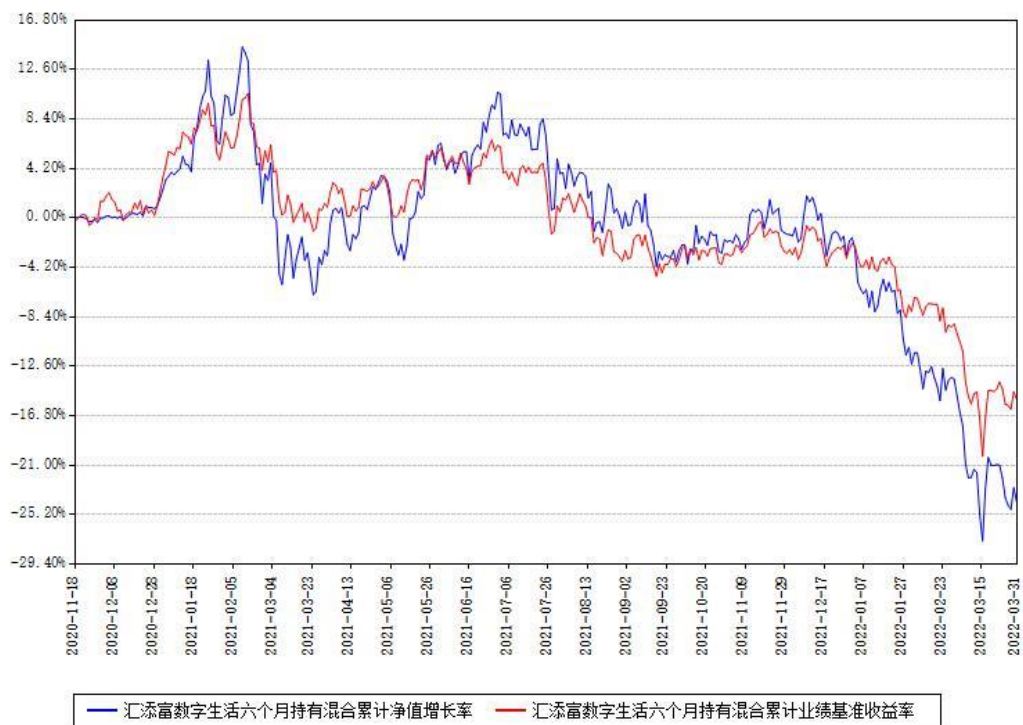
汇添富数字生活六个月持有混合累计净值增长率与同期业绩基准收益率对比图