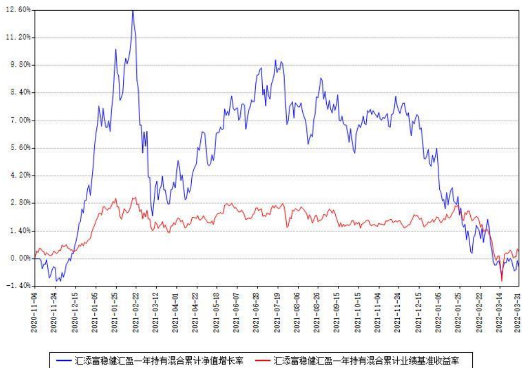
汇添富稳健汇盈一年持有混合累计净值增长率与同期业绩基准收益率对比图