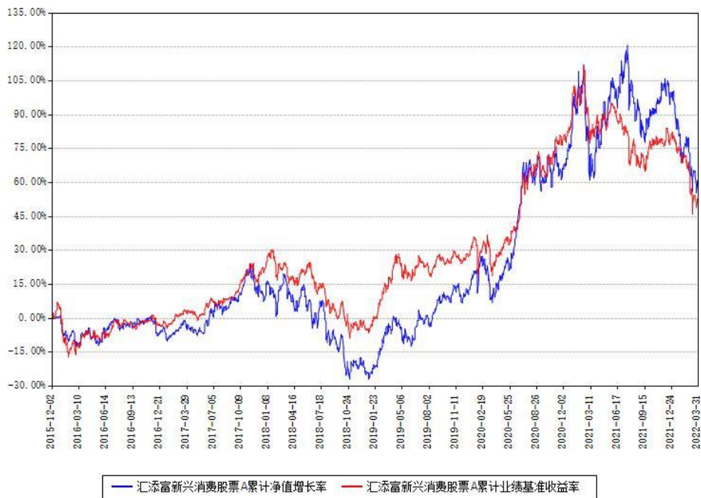
汇添富新兴消费股票A累计净值增长率与同期业绩基准收益率对比图

(二)自基金合同生效以来基金累计净值增长率变动及其与同期业绩比较基准收益率变动的比较图