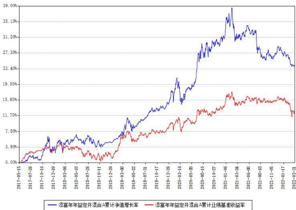
添富年年益定开混合A累计净值增长率与同期业绩基准收益率对比图