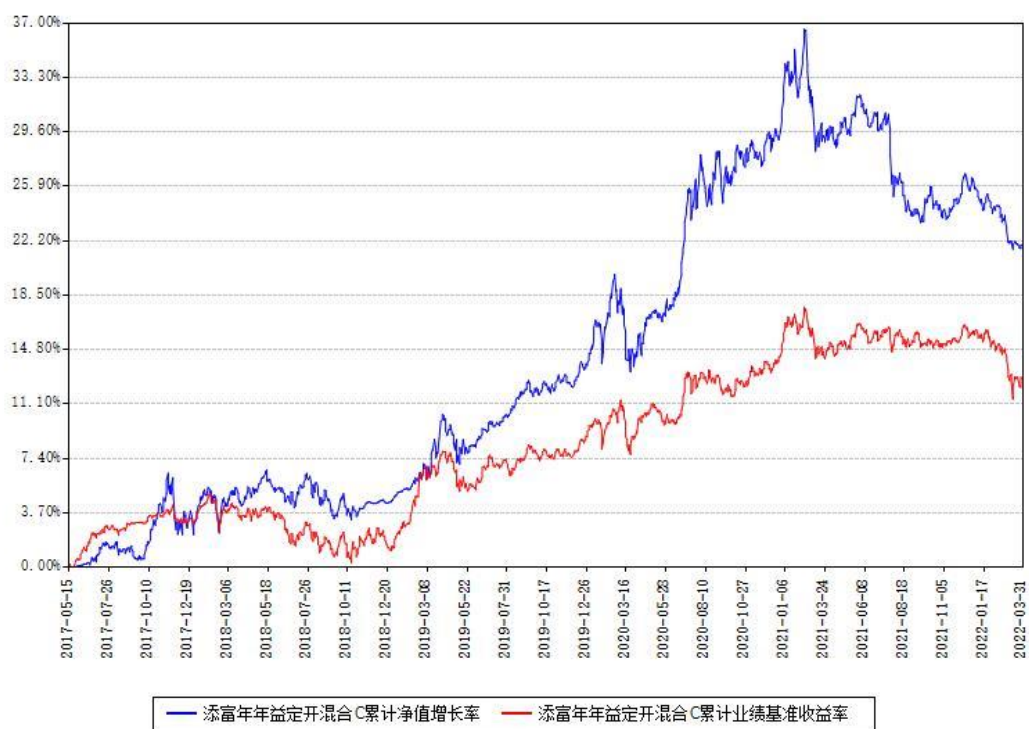
添富年年益定开混合C累计净值增长率与同期业绩基准收益率对比图