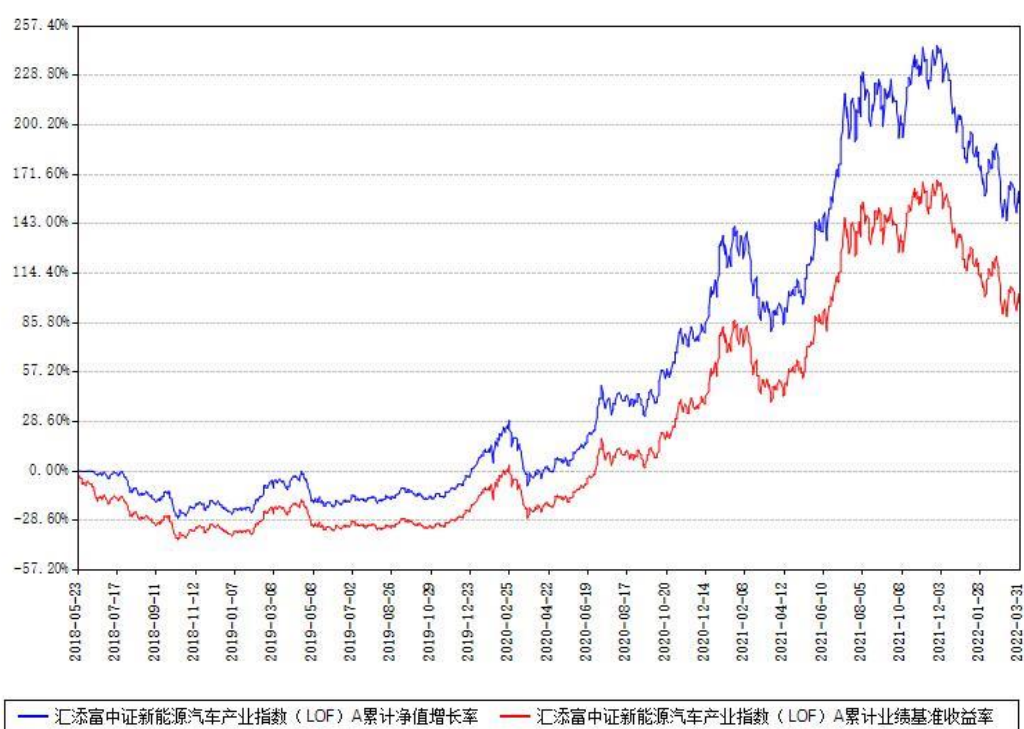
汇添富中证新能源汽车产业指数（LOF）A累计净值增长率与同期业绩基准收益率对比图