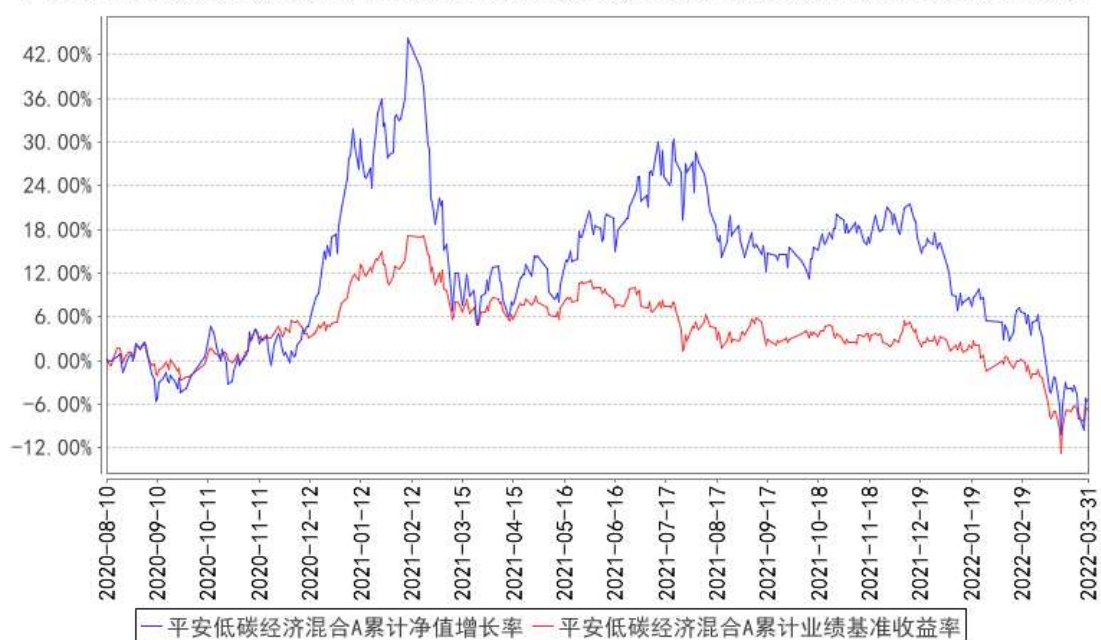
平安低碳经济混合A累计净值增长率与同期业绩比较基准收益率的历史走势对比图