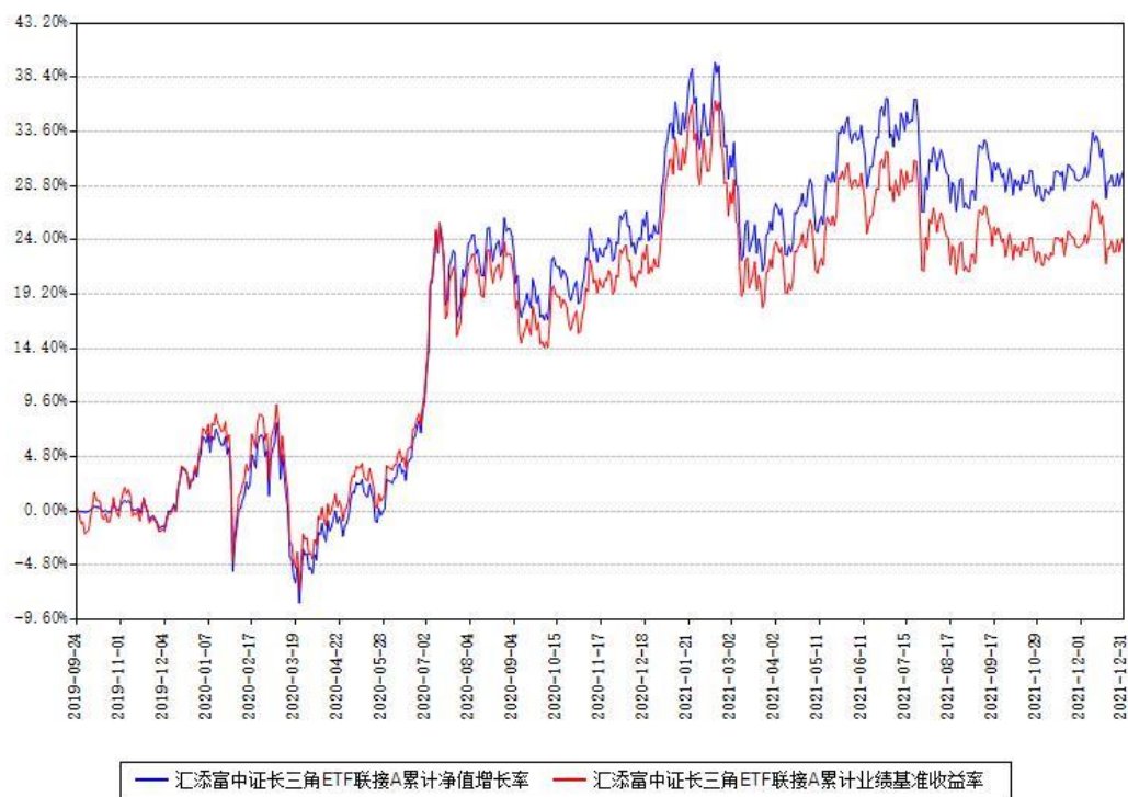
汇添富中证长三角ETF联接A累计净值增长率与同期业绩基准收益率对比图