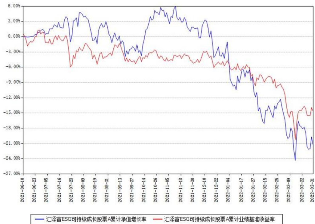
汇添富 ESG 可持续成长股票 A 累计净值增长率与同期业绩基准收益率对比图