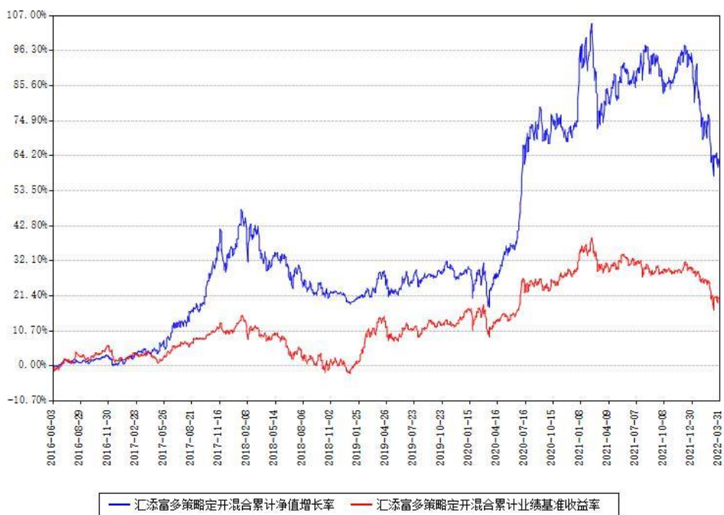
汇添富多策略定开混合累计净值增长率与同期业绩基准收益率对比图