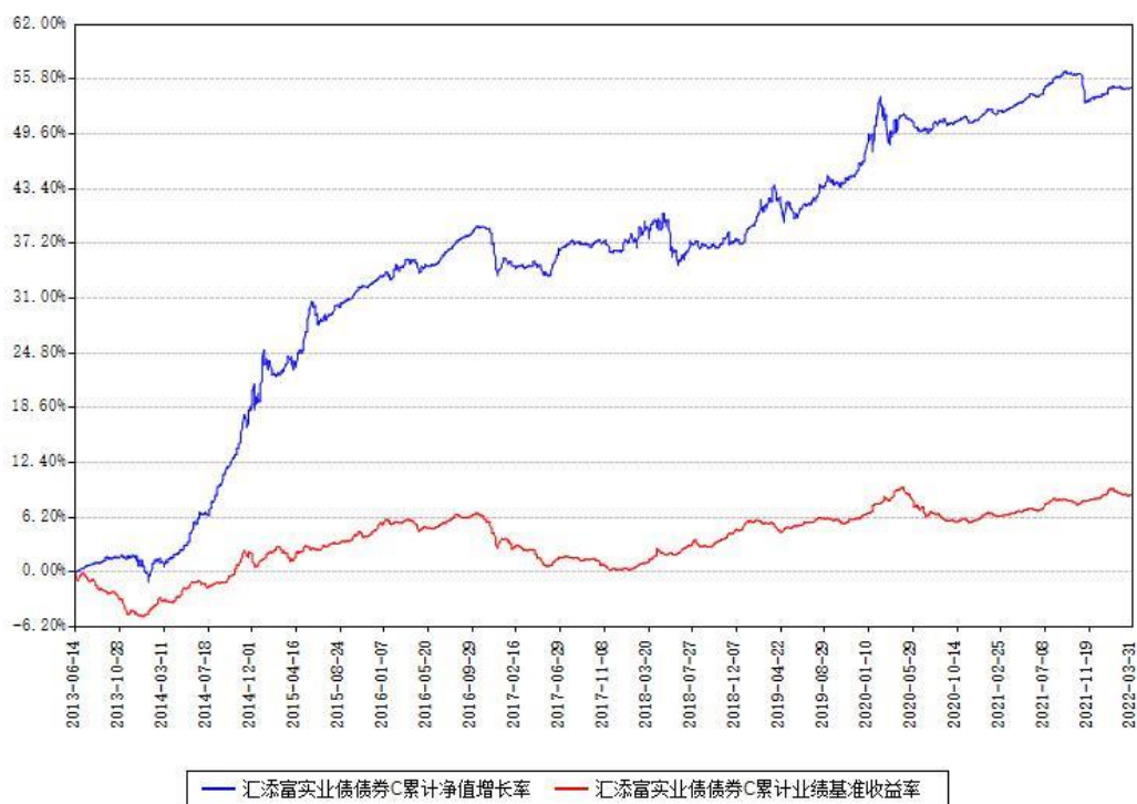
汇添富实业债债券C累计净值增长率与同期业绩基准收益率对比图