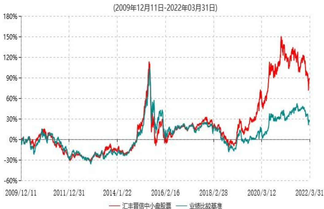
汇丰晋信中小盘股票型证券投资基金累计净值增长率与业绩比较基准收益率历史走势对比图

注：1. 按照基金合同的约定，本基金的股票投资比例范围为基金资产的 85%-95%，其中，将不低于 80%的股票资产投资于国内 A 股市场上具有良好成长性和基本面良好的中小上市公司股票。本基金权证投资比例范围为基金资产净值的 0%-3%。本基金固定收益类证券和现金投资比例范围为基金资产的 5%-15%，其中现金（不包括结算备付金、存出保证金、应收申购款等）或到期日在一年以内的政府债券的投资比例不低于基金资产净值的 5%。按照基金合同的约定，本基金自基金合同生效日起不超过 6 个月内完成建仓，截止 2010 年 6 月 11 日，本基金的各项投资比例已达到基金合同约定的比例。