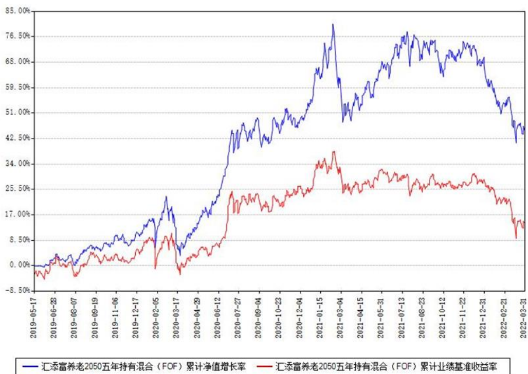
汇添富养老2050五年持有混合 (FOF) 累计净值增长率与同期业绩基准收益率对比图