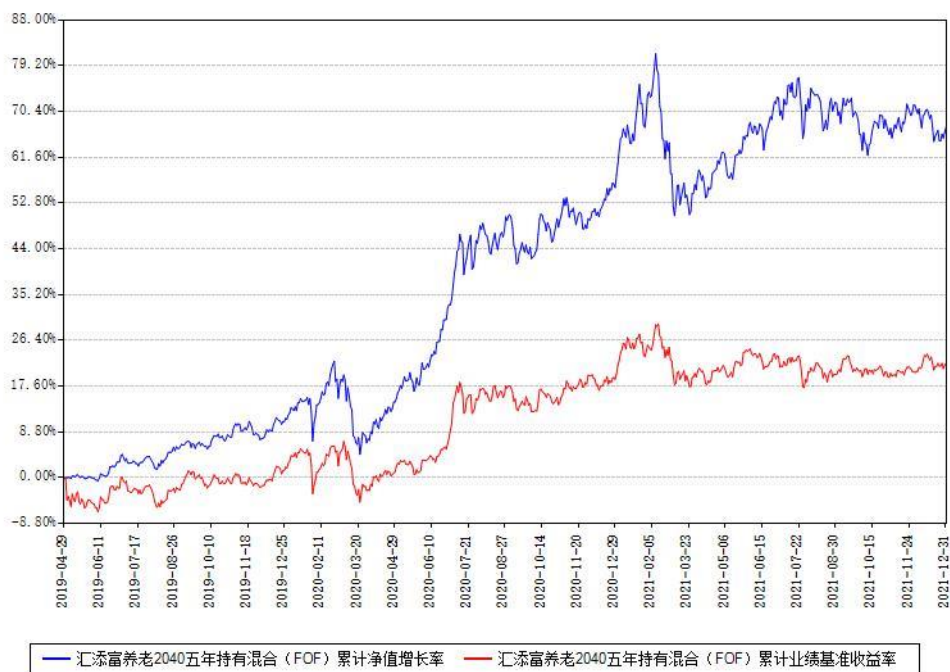
汇添富养老2040五年持有混合 (FOF) 累计净值增长率与同期业绩基准收益率对比图

(二) 自基金合同生效以来基金累计净值增长率变动及其与同期业绩比较基准收益率变动的比较图