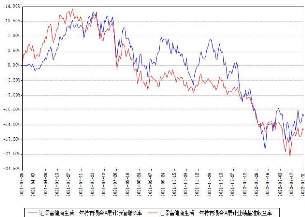
汇添富健康生活一年持有混合A累计净值增长率与同期业绩基准收益率对比图