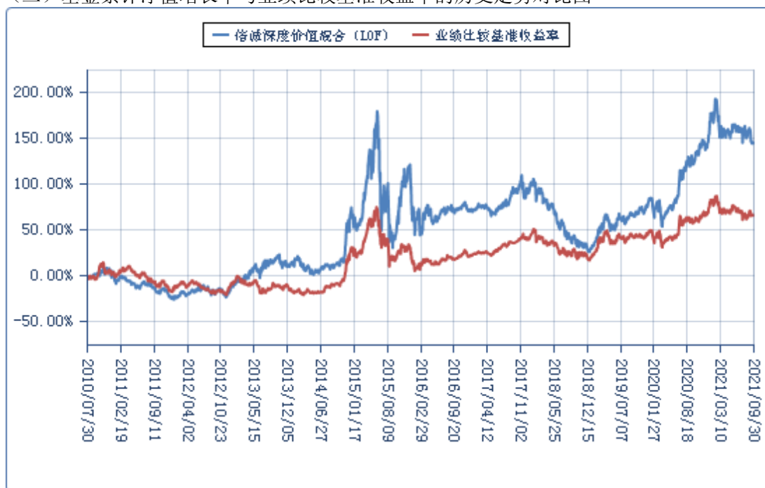
(二) 基金累计净值增长率与业绩比较基准收益率的历史走势对比图