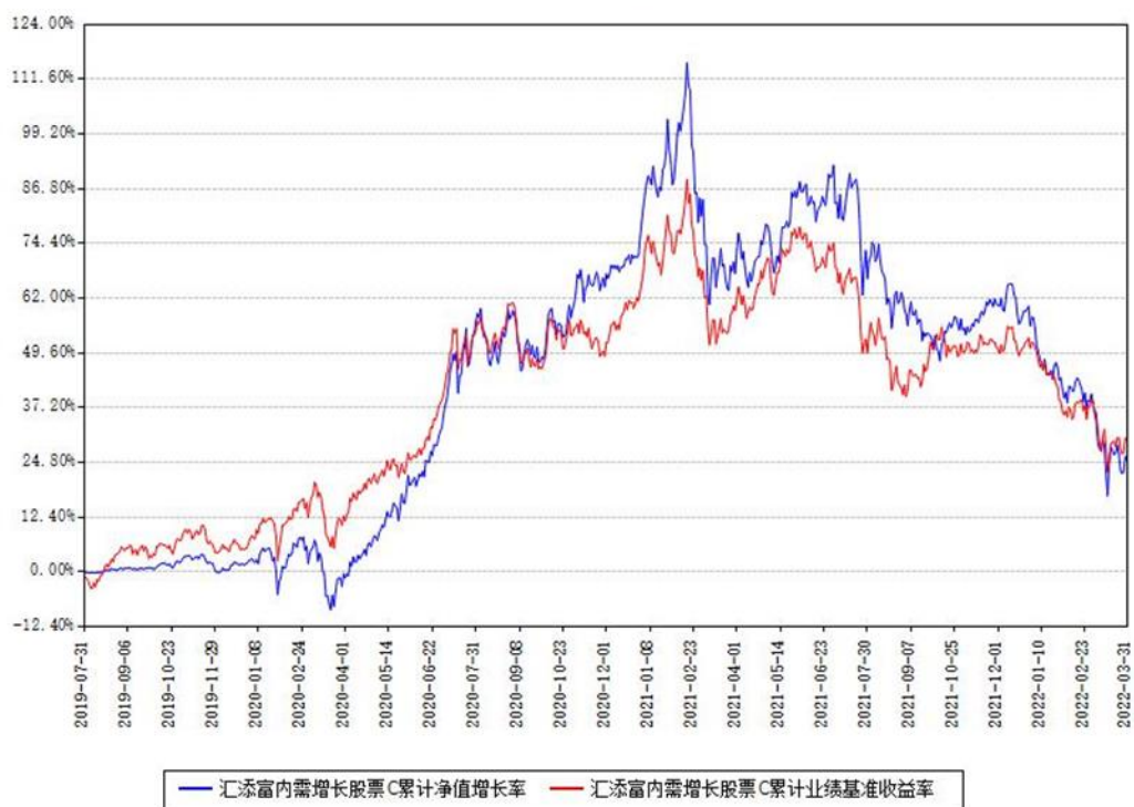
汇添富内需增长股票C累计净值增长率与同期业绩基准收益率对比图