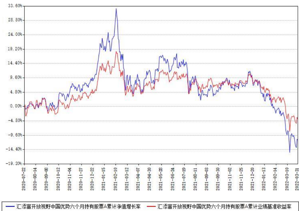
汇添富开放视野中国优势六个月持有股票A累计净值增长率与同期业绩基准收益率对比图