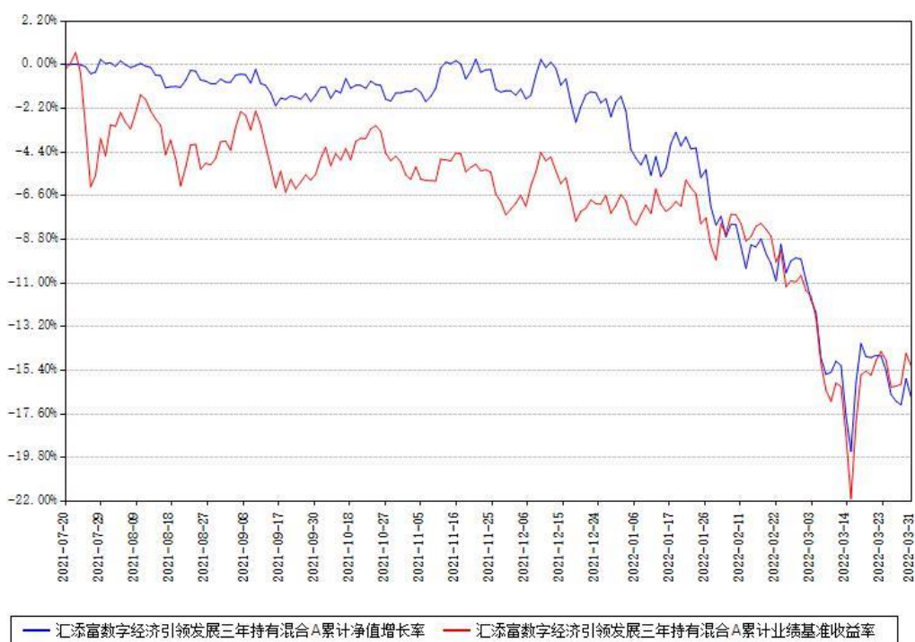
汇添富数字经济引领发展三年持有混合A累计净值增长率与同期业绩基准收益率对比图