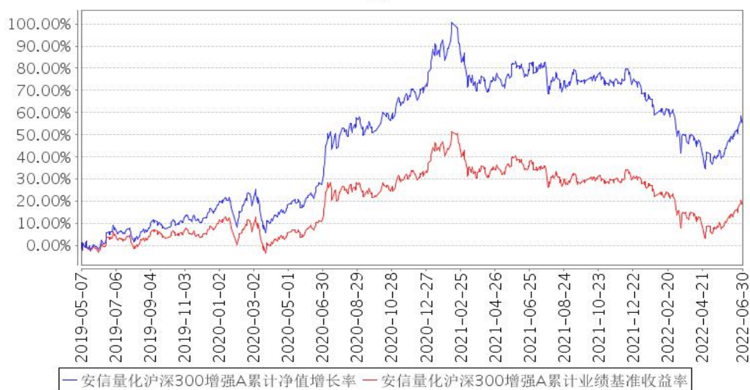
安信量化沪深300增强A累计净值增长率与同期业绩比较基准收益率的历史走势对比图