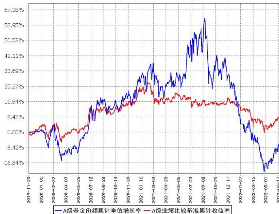
A级基金份额累计净值增长率与同期业绩比较基准收益率的历史走势对比图 (2019年11月20日至2022年6月30日)