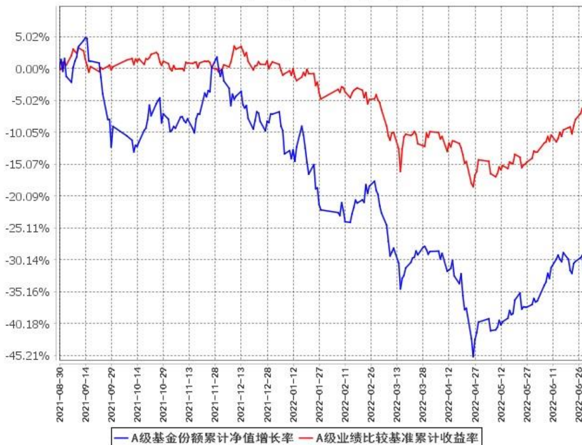
A级基金份额累计净值增长率与同期业绩比较基准收益率的历史走势对比图 (2021年8月30日至2022年6月30日)