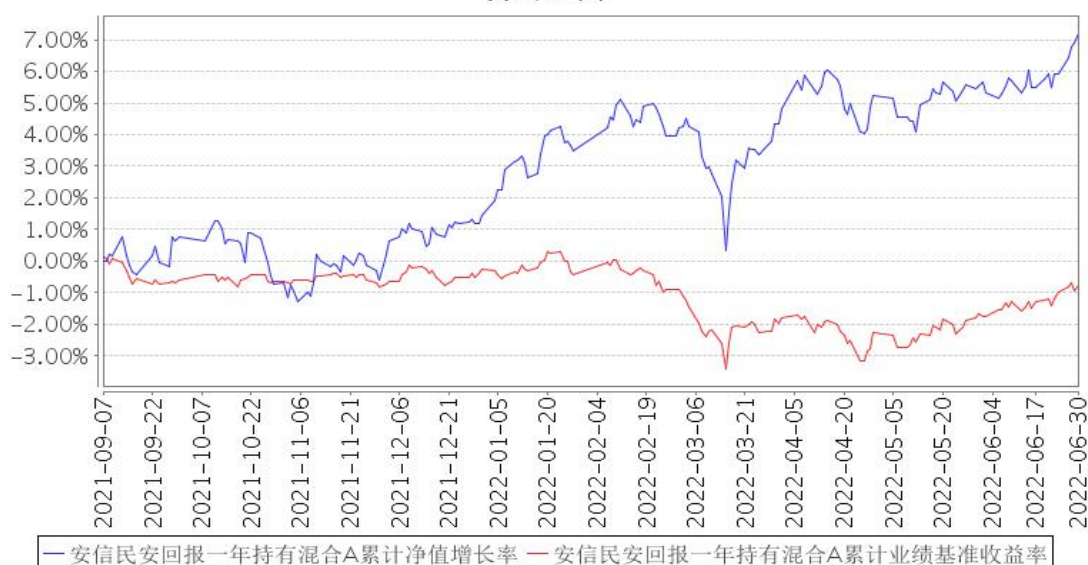
安信民安回报一年持有混合A累计净值增长率与同期业绩比较基准收益率的历史走势对比图