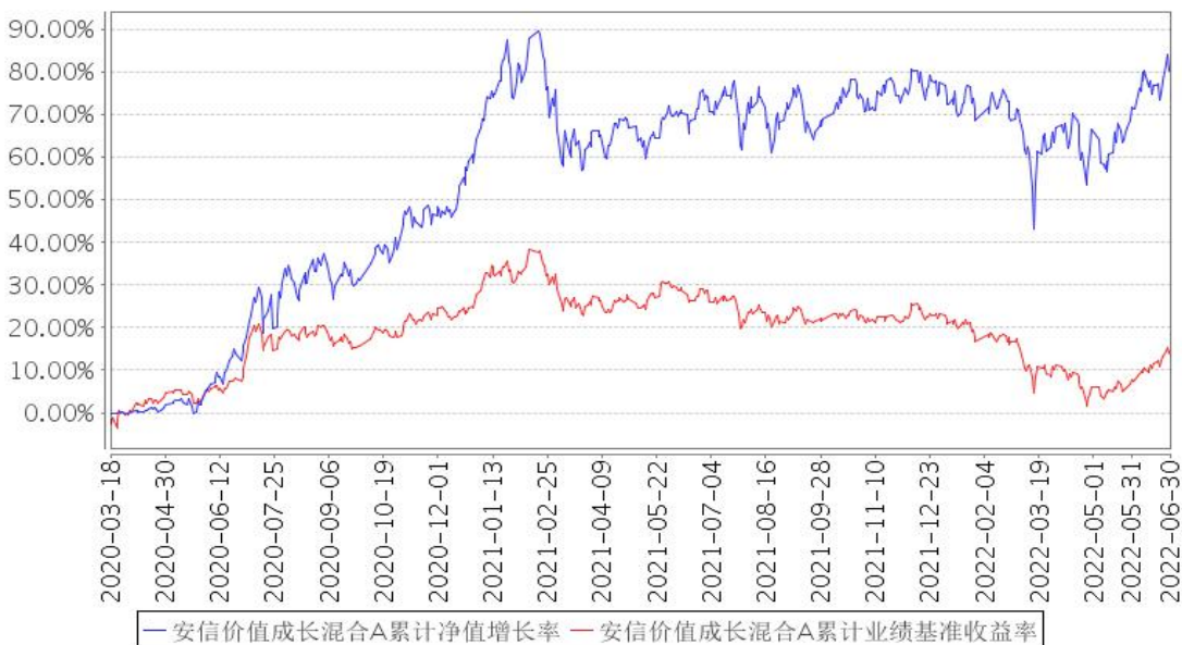
安信价值成长混合A累计净值增长率与同期业绩比较基准收益率的历史走势对比图